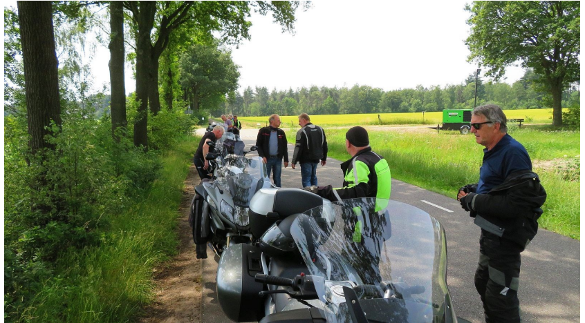
Even de benen strekken