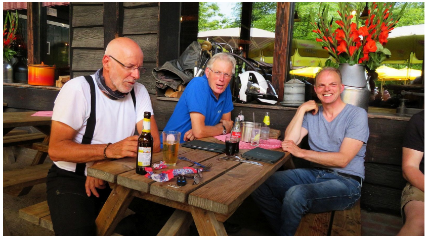
Herberg "In den Bockenreyder" - lunch

We rijden nu in het land waar mijn vrouw is geboren. In haar paspoort staat dat zij is geboren in Oost-, West-, Middelbeers. Ik ben er nog steeds niet achter welke van de drie. Wel dat het een bosrijke omgeving is. Het is goed dat we allemaal lekker in het motorpak zitten met handschoenen en helm op want de Eikenprocessierups is rijkelijk aanwezig dit jaar. Anders jeuk je de tent uit ( oh, dat was het; bedankt Rein - red. )