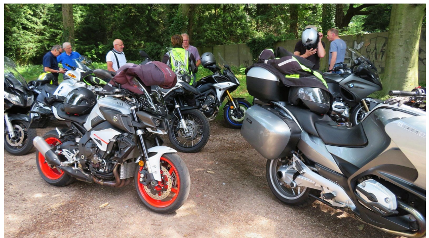
Tussenstop - er zijn veel andere motoren aangeschaft

wat alleen bestemd is voor bestemmingsverkeer? Ik denk dat ze meer onder indruk waren van die grote trekker die uit dat weggetje kwam en daardoor het bord niet gezien hebben.