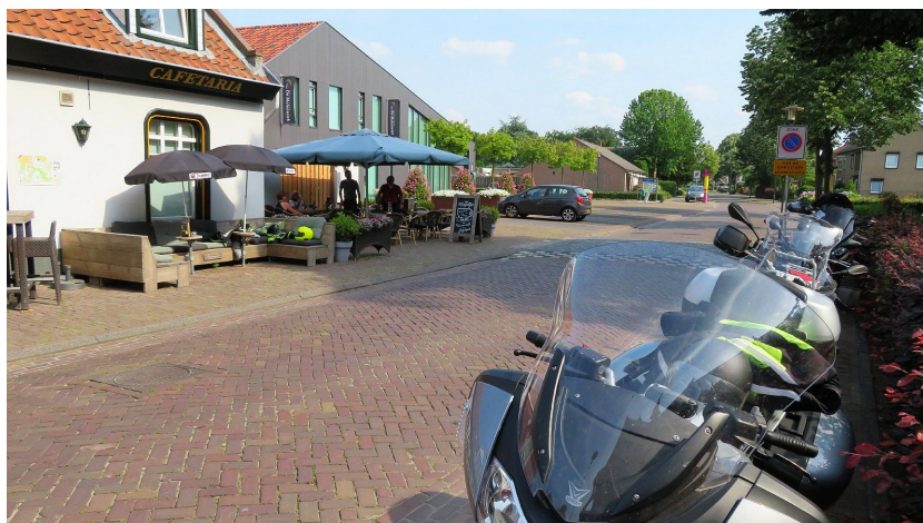
Café 't Engeltje - eindpunt van deze mooie rit